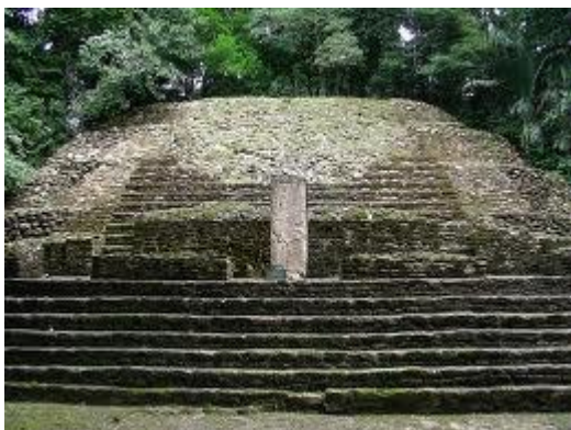
Ruines Maya de Lamanai (Nord Belize) –Petit temple avec la Stèle n°9 dédiée à une personne Maya qui était en connexion avec un Haut Dirigeant des Quartiers Généraux de la Terre autour de 650 après J.C.

Il y a eu des dynasties parmi les Mayas, de grand rois et de grand prêtres très capables avec qui nous avons pu communiquer et donner notre connaissance.