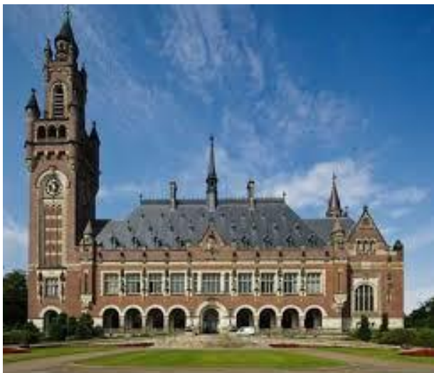
Vredespaleis Den Haag (Nederland)

Bijeenkomst voor het Vredespaleis in Den Haag