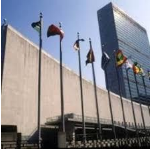
Hoofdkantoor Verenigde Naties New York

Verzamelpunt 1: USA – New York :Gebouw van de Verenigde Naties.