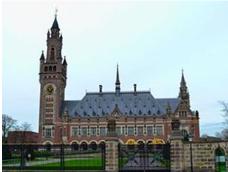
Vredespaleis Den Haag

Het Internationaal Gerechtshof (ook wel Internationaal Hof van Justitie genoemd; Frans: Cour internationale de justice; Engels: International Court of Justice, ICJ ) is het belangrijkste gerechtelijke orgaan binnen de Verenigde Naties . Het hof houdt zich bezig met rechtsgeschillen tussen staten.