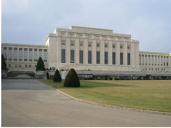
Palais des Nations Genève