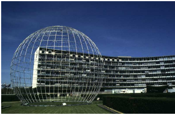
Unesco House Parijs.