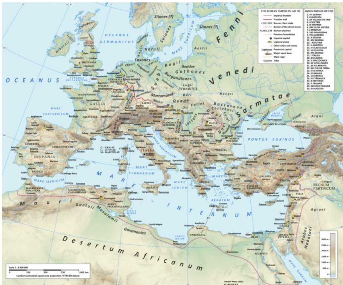
Romeinse kaart met hun bezette gebieden.

{Nota Kathy Januari 2014: Teutonen: het betreft Keltische - Germaanse stammen die in kleine dorpen leefden en die meer dan 2.000 jaar geleden van het noorden van Denemarken afkwamen en het leven van de Romeinen heel zuur hebben gemaakt. Ze zijn afgezakt langs de Donau, Frankrijk en Spanje en zijn zelfs Engeland binnengevallen. De Romeinen hebben nooit een gebied kunnen veroveren van de andere kant van de Rijn, noch de Donau. Het betreft hier niet de 'Teutonische Ridders' of "Duitse Orde" die een geestelijke ridderorde was en geen vrije mensen waren, ontstaan tijdens de derde kruistocht in de 12 de eeuw, 700 jaar geleden voor oorlogsdoeleinden.}