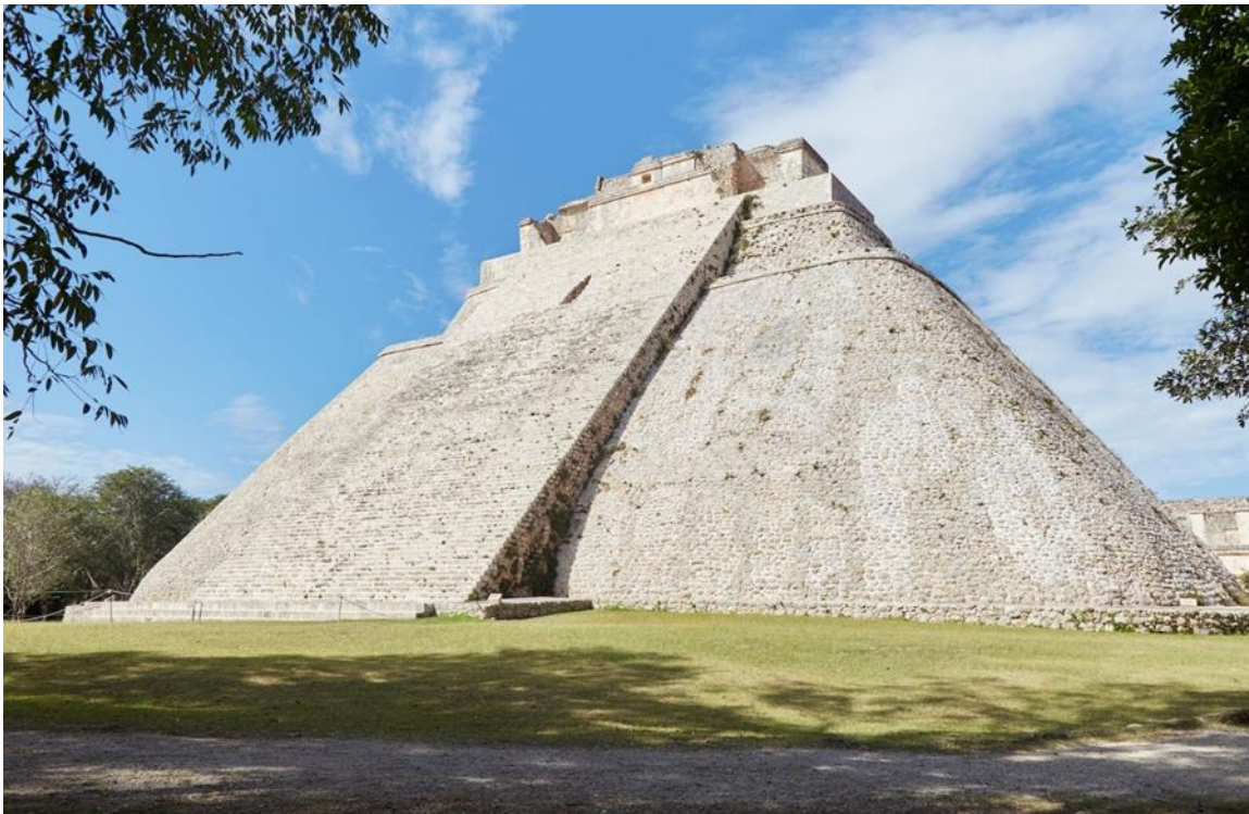
Templo maya de UXMALL.

Salí para Placencia a la hora señalada para la meditación y cuando ya casi estaba allí, me llevaron a otro lugar. Me encontré en la cima del gran templo de la antigua ciudad maya de Uxmal, ubicada debajo de Mérida, en la península de Yucatán, México.